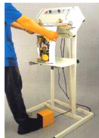
UM-650 + Mesa Soporte