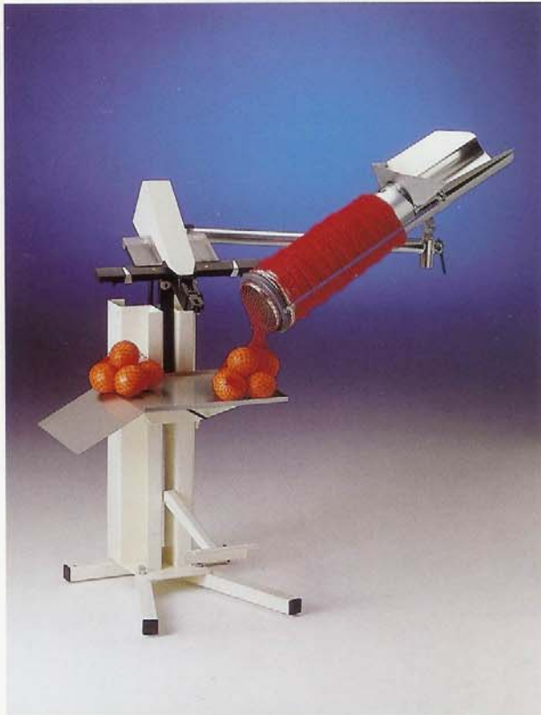
FT-14 PEDAL O NEUMÁTICA FT-14 FOOD OR PNEUMATIC VERSION